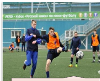
Кубок Русской кожи по мини-футболу

В 2016 году – открыт филиал по дзюдо СДЮСШОР «Родной край», в Школе № 58 микрорайона Канищево.