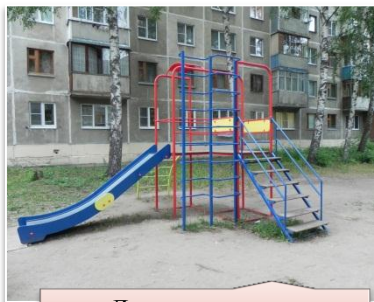
Детское игровое оборудование