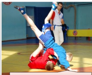
филиал СДЮСШОР "Родной край" в школе № 58

всю историю проведения турнира в городе Рязани и области - 132 команды.