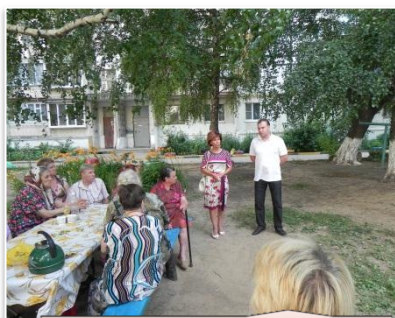
А у нас во дворе